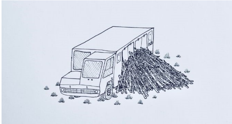
Zeichnung: Fabian Holzinger