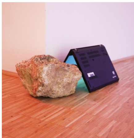
Conversation with Computers – Everything – Sebastian Mira