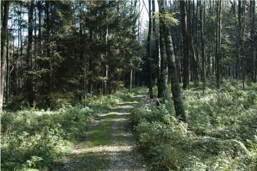
Rund 5.000.000 m 2 Wald befinden sich im Besitz der Stadt Linz (Bild: Schiltenbergwald).