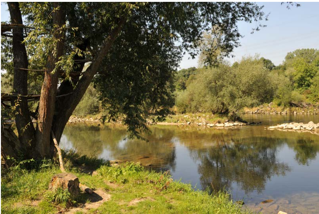
Mit mehr als 2.000.000 m 2 befinden sich rund 80 Prozent des Naturschutzgebietes Traunauen im Eigentum der Stadt Linz.