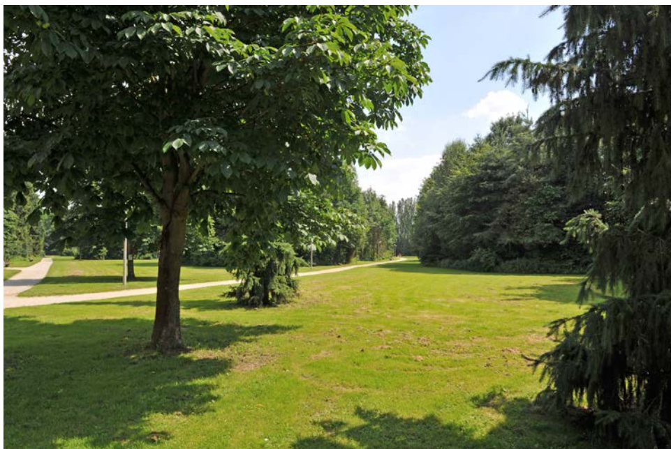
Der Heilham-Park in Urfahr lädt zum Spaziergehen im Grünen ein.