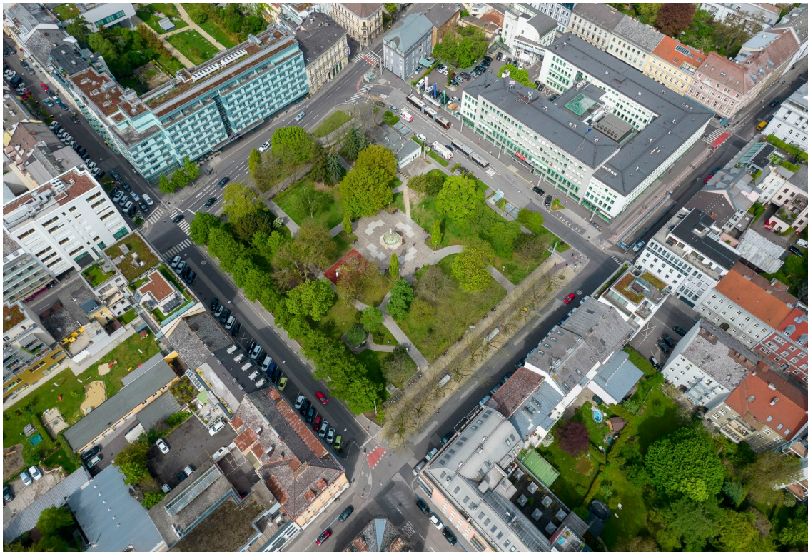
Der Hessenplatz als Beispiel eines innerstädtischen Parks

In jüngster Vergangenheit kamen neue Parkflächen hinzu, beispielsweise jene, die 2017 im Zuge der Errichtung der Grünen Mitte Linz entstanden sind und 2021 die Parkanlage Sombartstraße in Urfahr.