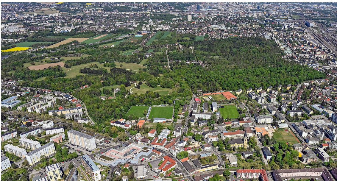
Wasserwald in Kleinmünchen-Auwiesen

Zu den Grundstücken im Besitz der Stadt Linz kommen Grundstücke der Linz AG, die einige der schönsten Linzer Erholungsflächen besitzt. Die größte von ihnen ist der 156 ha große „Wasserwald“ in Kleinmünchen. Das zum Teil aus Wald bestehende Wasserschutzgebiet Plesching mit Laufstrecken und Radwegen misst 66,9 ha. Auch das Wasserschutzgebiet Heilham in Urfahr ist eine sehr beliebte Naherholungszone in Urfahr. Der Pichlingersee und seine Uferzonen sind 64,2 ha groß, der Pleschingersee 39,7 ha.