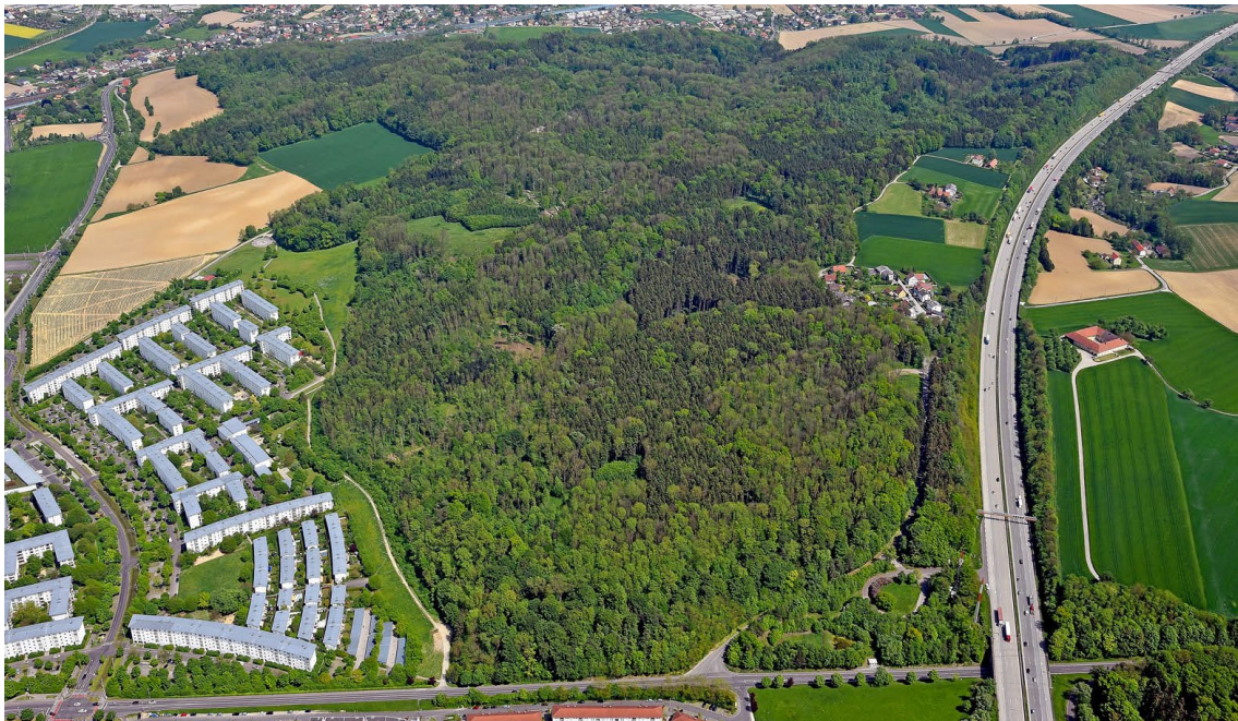
Der Schiltenbergwald in Ebelsberg – 1995 erwarb die Stadt noch 100 ha zur Sicherung des Grüngürtels; Foto: PTU, Pertlwieser

Insgesamt sind 18 Prozent des Stadtgebietes bewaldet. Mehr als ein Viertel des Linzer Waldes ist im Besitz der Stadt, die damit größte Waldbesitzerin von Linz ist. 471 ha gehören der Stadt, also fast 30 Prozent der Wälder. Diese werden von städtischen Mitarbeiter*innen fachkundig betreut.