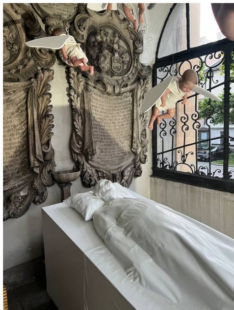
Bruckner Schrein (Detail), Foto: Lili Androsch