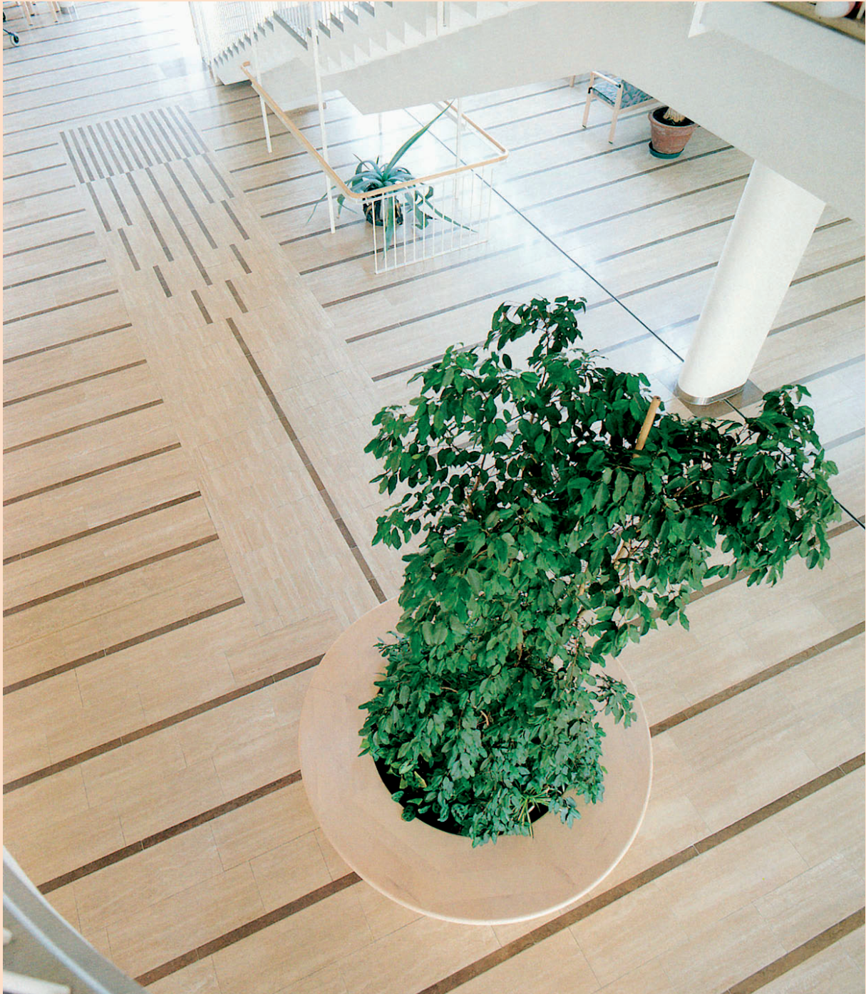
Wolfgang Stifter: Fliesen, 10,10 x 1,70m