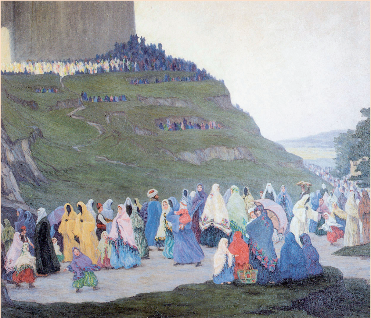
Unbekannter Ungarischer Künstler (um 1900): „Großes Bergfest“, Öl/Leinwand, 105 x 120 cm