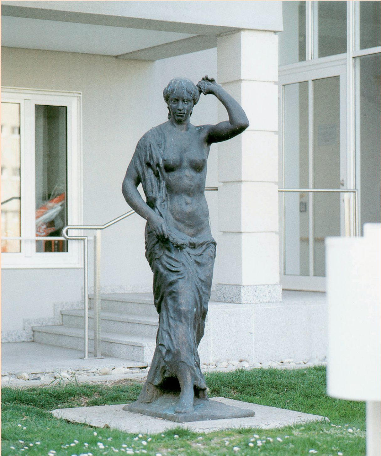
Alois Dorn: „Flora“, 1935, Bronze, ca. 210 cm hoch