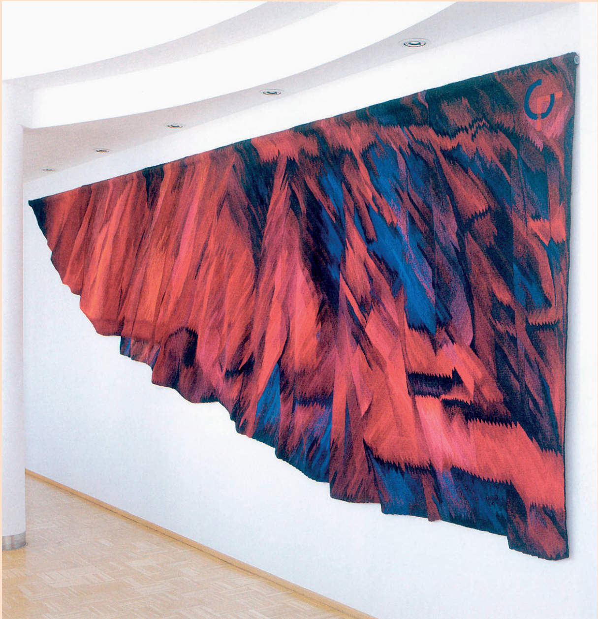
Anna Goldgruber: Teppich, 170 x 510 cm