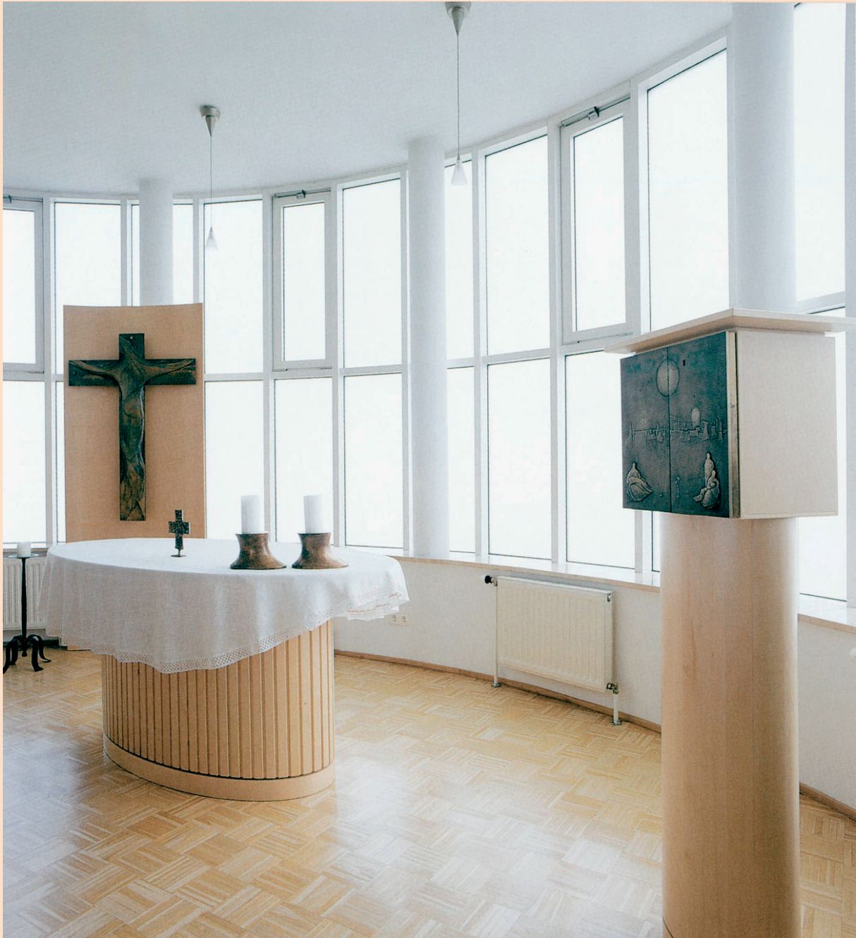
Casilda Perez Hernandez: Kapelle. Kreuz, Messing, 130 x 90 cm; Tabernakel, Messing, 40 x 40 cm