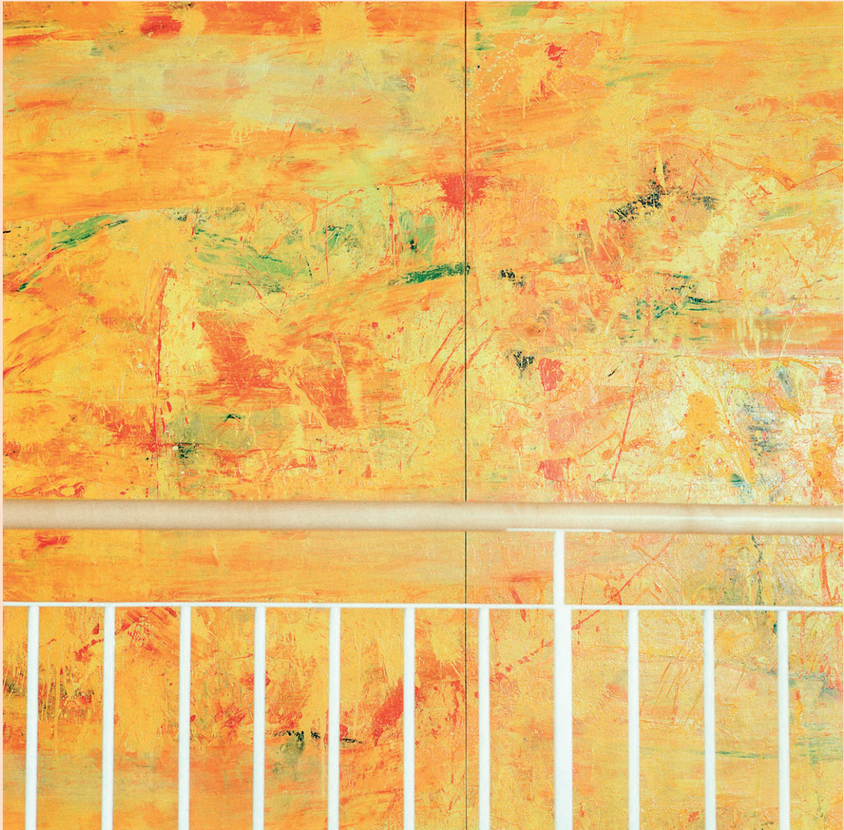
Konrad Winter: Ölmalerei, 200 x 450 cm, 3teilig