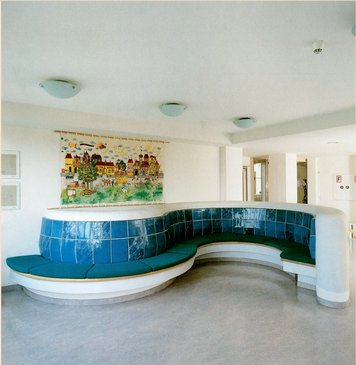
Hedwig Rückerl: Wärmeofen, Keramik, ca. 5 m Durchmesser