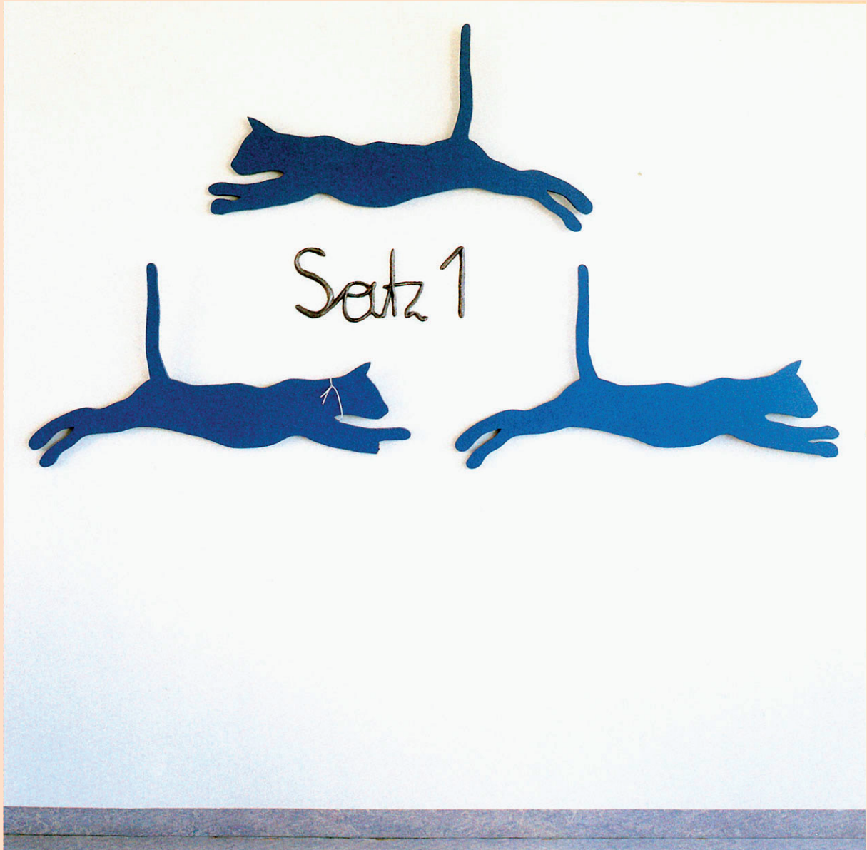
Gerhard Knogler: „Satz 1“. Holz, Katzensprung 107 cm, gesamt 215 cm