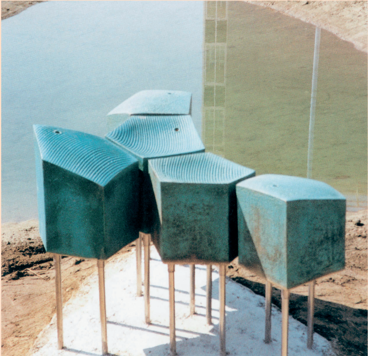
Hedwig Rückerl: Keramik-Vogeltränke im Biotop